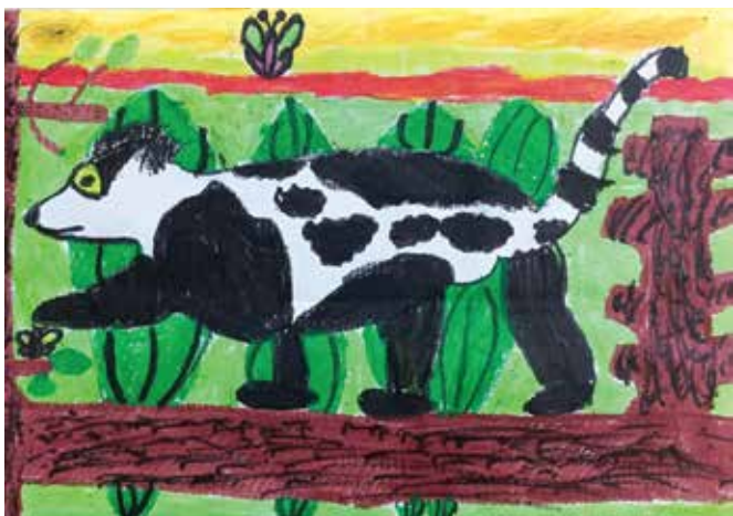
Domen Perš: Lemur

Učenci so proučevali, kako posamezna žival izgleda, kako se prehranjuje in kje se zadržuje. Po končani predstavitvi vseh živali, so se odločili za eno, ki so