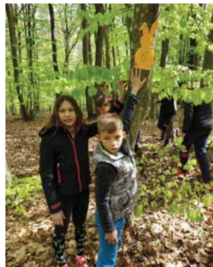
Zajčka smo našli, zdaj pa še uganko.