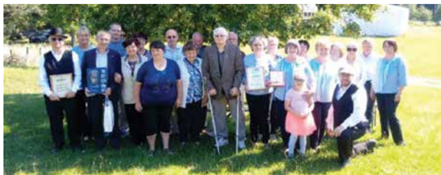
Skupinska fotografija