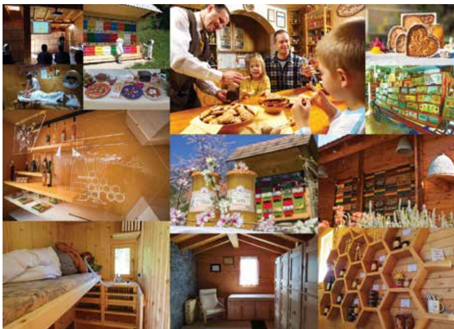
Aktivnosti v okviru ponudbe apiturizmov, foto: arhiv ČZS

dežele. Obsega edinstvena doživetja, je izobraževalne narave in razvija spoštovanje do naravnega, kulturnega in družbenega okolja. Ob obisku apiturizma si lahko ogledamo različne čebelarške muzejske zbirke ali pa se podamo v svet čebelarške kulturne dediščine, kjer spoznamo za Slovenijo tipični čebeljak in tradicionalne poslikave na panjskih končnicah. Svoje znanje lahko nadgradimo s spoznavanjem življenja čebel in z opazovanjem ter učenjem čebelarjevih opravil. V ponudbi apiturizmov so tudi degustacija čebeljih pridelkov, izdelkov iz čebeljih pridelkov kot so medenjaki, lectova srca, dražgoški kruhki, medene pijače, različne jedi v kombinaciji s čebeljimi pridelki, ustvarjalne delavnice, medene kopeli, masaže, vdihavanje panjskega zraka ter vrsto zanimivih dejavnosti in aktivnosti. Nekateri apiturizmi ponujajo tudi interaktivne vsebine, ki so povezane z inovativnostjo ponudnikov, realizacijo dobrih idej in tehnološkim napredkom. Vsak apiturizem piše svojo pristno in edinstveno zgod-