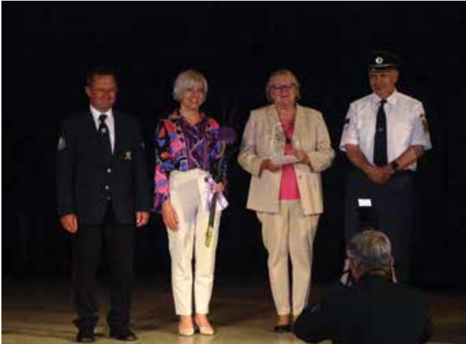
Zaključna prireditev v Gornji Radgoni.