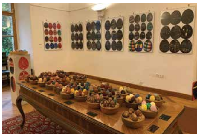
Razstava 484 izdelkov iz Mednarodnega natečaja v ustvarjanju z naslovom Moja remenka je bila do konca junija na ogled v razstavnih prostorih gradu Grad.