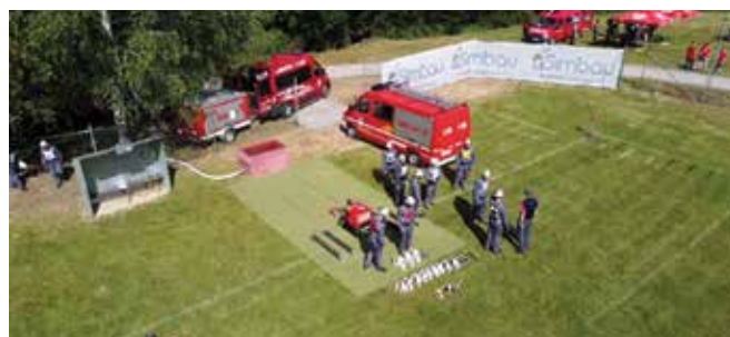
Priprava na vajo.

Enote so bile razvrščene v kategorije: pionirji, pionirke, pionirji-trojke, mladinci, mladinci-trojke, članice A, članice B, člani A, člani B in starejši gasilci. Pionirji so tekmovali v vaji z vedrovko in prenosu