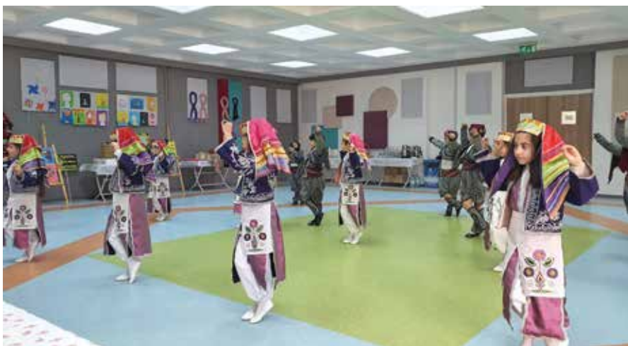
Tradicionalne noše in ples učencev.

Tema tokratne izmenjave je bila Naravoslovje, znanost in tehnologija. Bistveni del srečanja je iz-