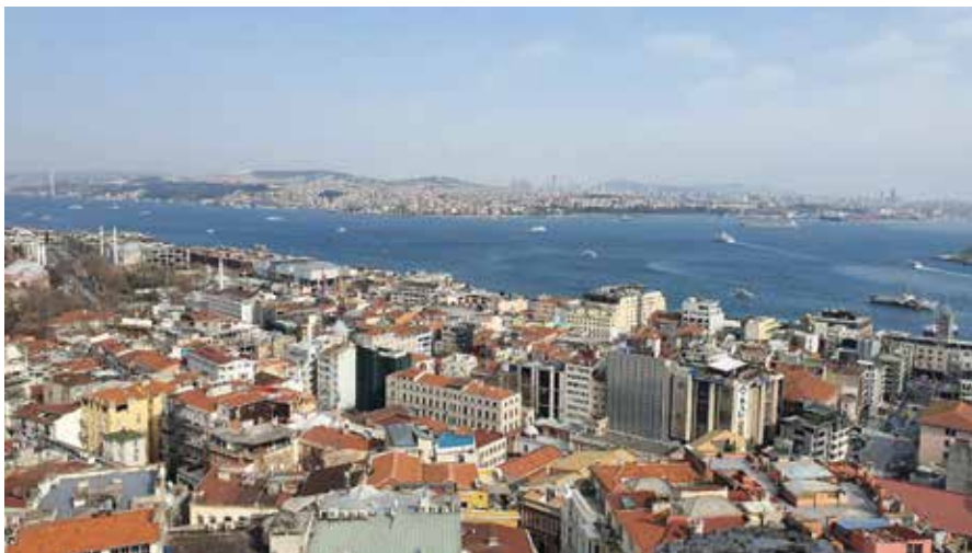
Pogled na Bosporsko ožino.

menjava primerov dobrih praks in izkušenj, ki smo si jih izmenjali v obliki delavnic, demonstracij pouka z učenci ter izvedbo jezikovnih delavnic in tradicionalnih iger. Gostujoča šola je prikazala zanimive aktivnosti, ki so neposredno prenosljive v prakso tudi pri nas. Preizkusili smo se v orientaciji v parku z zanimivo igro, v kateri so posamezne skupine sledile namigom za pridobitev posameznih kosov sestavljanke. Seveda je bilo sestavljanke mogoče sestaviti le s sodelovanjem vseh ekip. Učenci zadnjih razredov so prikazali različne projekte, uporabe mikro računalnika »pino« s stikali in različnimi senzorji. Ustvarili so samostojno zapornico, vodenje figure s pomočjo stikal iz plastelina in podobno. Na delavnici obnovljivih virov energije so učenci in gostujoči učitelji tekmovali v sestavi delujočega modela vetrne elektrarne, kar je zahtevalo timsko delo. Učenci so z nami delili različne tehnike ročnih del, tudi pletenja, ki smo se ga z nekoliko skepticizma, z veseljem lotili. Gostujoči učitelji smo izvedli učne ure za tamkajšnje učence. Učence smo naučili nekaj slovenskih besed z uporabo različnih iger. Predstavili smo se tudi v tradicionalnih slovenskih gibalnih