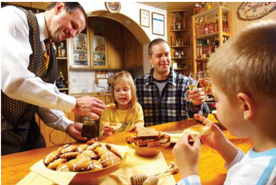
Degustacija čebeljih pridelkov in izdelkov iz čebeljih pridelkov

bo, ki jo spoznamo le na ta način, da ga obiščemo in se prepustimo toku dogajanja.