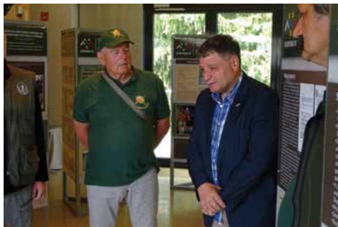
Otvoritev razstave.