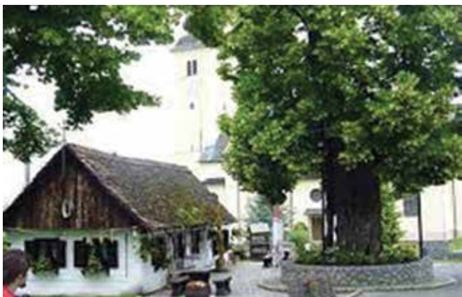
Gubčeva lipa v Gornji Stubici