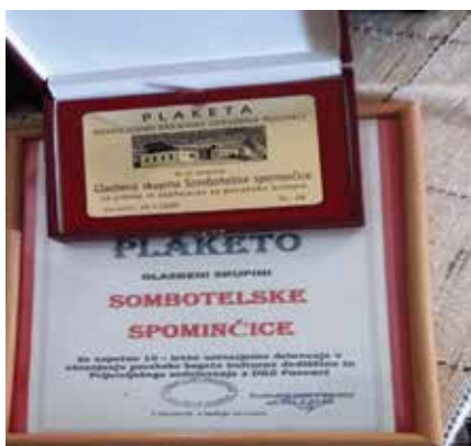
Najvišje odličje DKZP za jubilej in priznanje za uspešno delovanje v ohranjanju porabske bogate kulturne dediščine