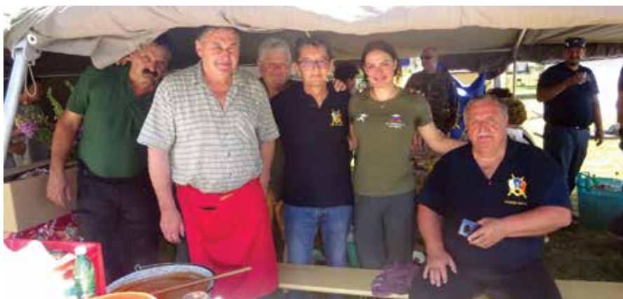
Ekipe O ZSČ in O ZVVS Murska Sobota in gosti

ko so člani O ZSČ Murska Sobota cvrli langaš. Na našem prostoru je bilo zelo živahno in smo imeli zelo veliko obiskovalcev. Naš predstavitveni prostor je s svojim obiskom počastila pripadnica športne enote SV, vrhunška smučarka, Andreja Slokar, ki je tudi okusila naše jedi in se je odžejala z goričko kapljico.