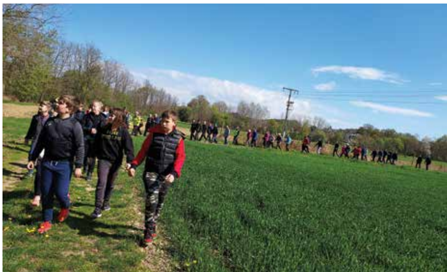
Učenci pozorno opazujejo, da ne bi spregledali kakšnega zajčka.