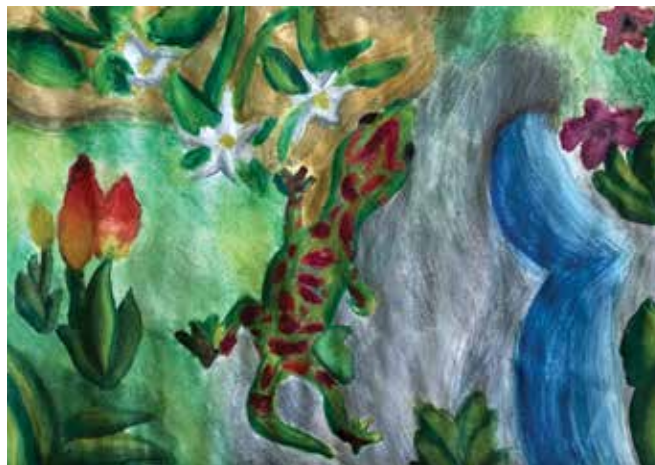
Zoja Benko: Gekon

Nastalo je veliko kreativnih in likovno bogatih del, ki smo jih poslali na natečaj v upanju, da se bodo uvrstili med najboljše.