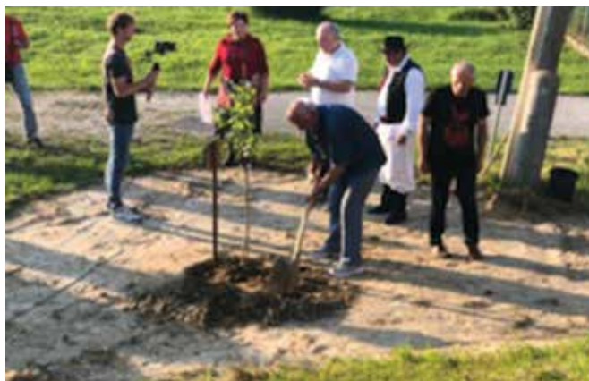
Sajenje lipe v Moščancih