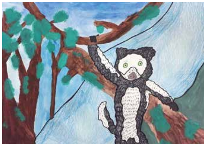
Gala Zupančič: Vari