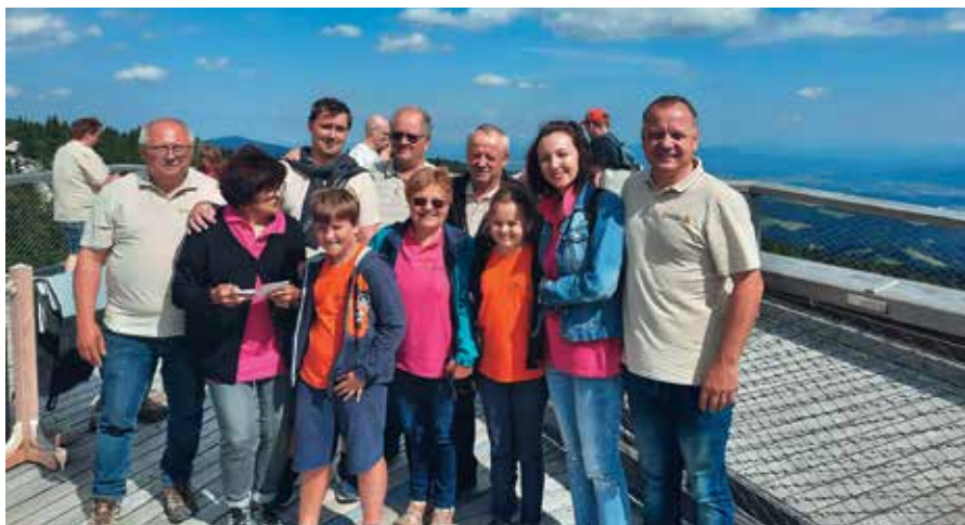
Člani ČD Puconci med krošnjami na Pohorju.