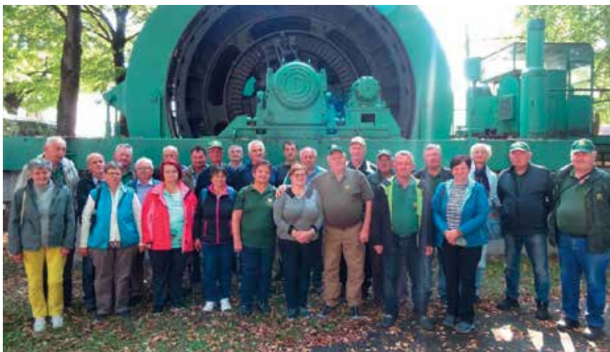
Udeleženci strokovne ekskurzije pred odhodom v jamo.