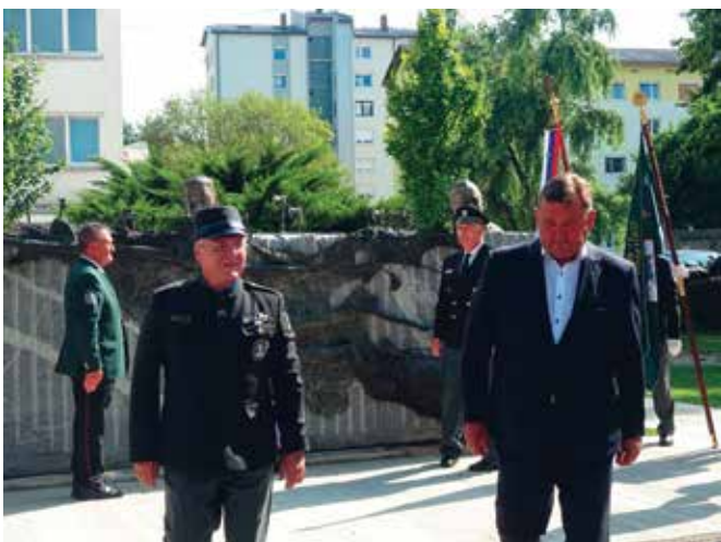
Polaganje venca pri obeležju v Murski Soboti.