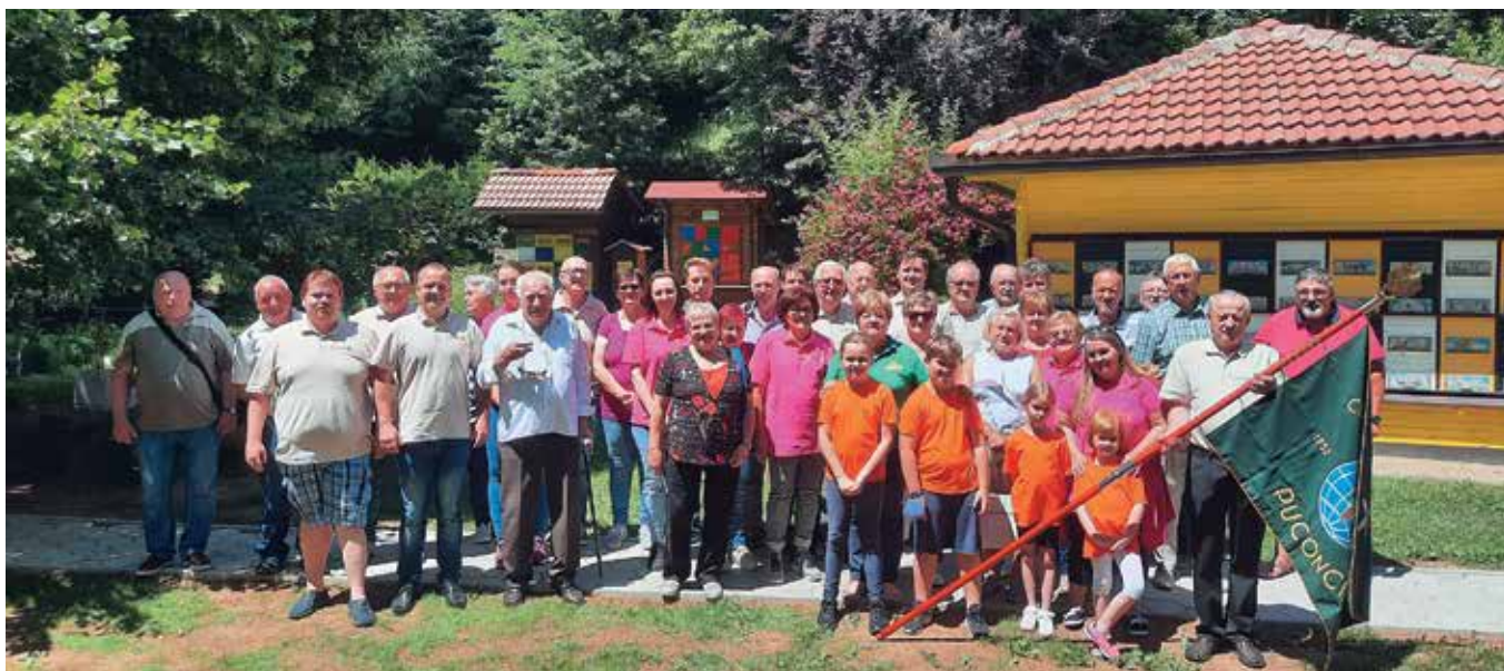
Člani ČD Puconci pred Čebelarškim domom ČD Lovrenc na Pohorju.

Naša prva postojanka je bil Muzej hidroelektrarne Fala. Čebelarji in čebelarke smo bili navdušeni nad močjo vode, ki jo je človek, že pred davnimi časi začel izkoriščati v svoj prid. Ogled prvotne strojnice in turbine je bil še posebej zanimiv. Po ogledu muzeja nas je pot vodila po Dravski dolini, do čebelarškega doma Čebelarškega društva Lovrenc na Pohorju, kjer so nas toplo sprejeli in nam razkazali svoj čebelarški dom z oko-