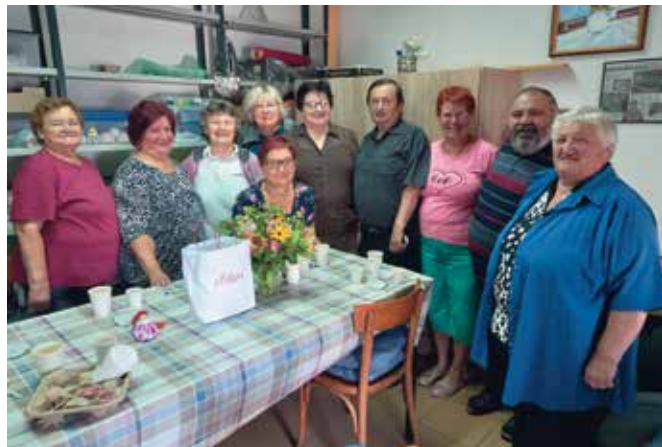
Člani društva in župan s slavljenko