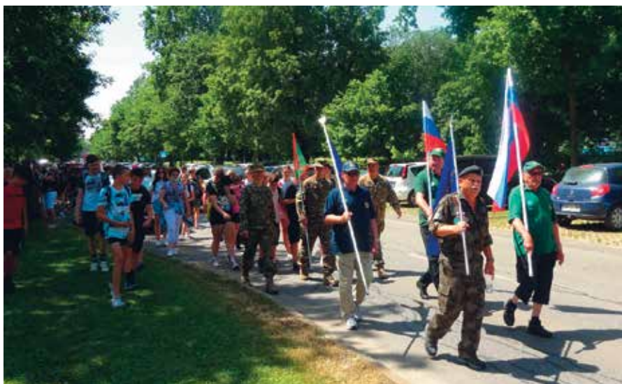
Pohod učencev po Murski Soboti.