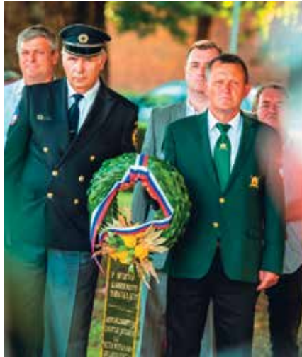
Polaganje venca pri obeležju v Beltincih.