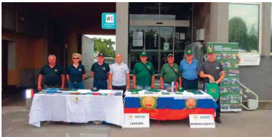
Predstavniki ZVVS, SEVER in ZSC na predstavitvi tehničnega zbora v Murski Soboti.