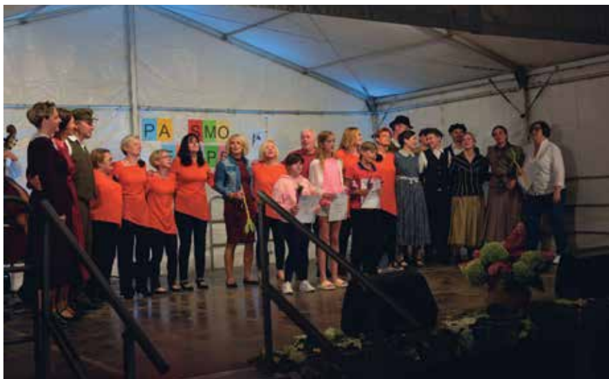
Prejemniki priznanj 2020 in 2021