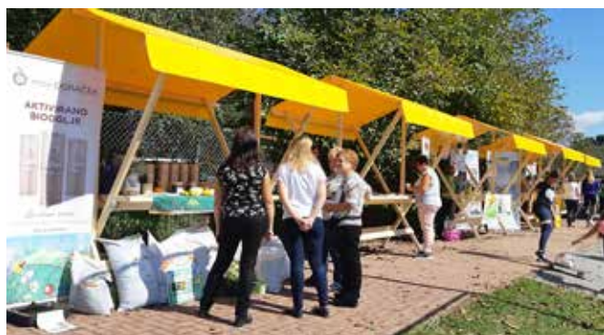
Stojnice – aktivnosti pri Spominskem domu Š. Kūzmiča

Razen izvedenih aktivnosti smo si ogledali in posodobili tudi register divjih odlagališč. Žal se na območju občine Puconci nahaja še veliko odlagališč, čeprav se jih je veliko že v preteklih čistilnih akcijah saniralo. Večina teh divjih odlagališč je sicer nastalo v preteklosti, ko je tako rekoč vsaka vas imela svoje divje odlagališče. Danes ta divja odlagališča zelo škodljivo vplivajo na okolje, saj onesnažujejo podtalnico, kvarijo videz pokrajine in kakovost življenja vseh živih bitij ter negativno vplivajo na zrak in prst. Na območju občine Puconci imamo evidentiranih 16 divjih odlagališč.