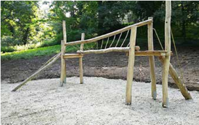
Igrala v grajskem parku