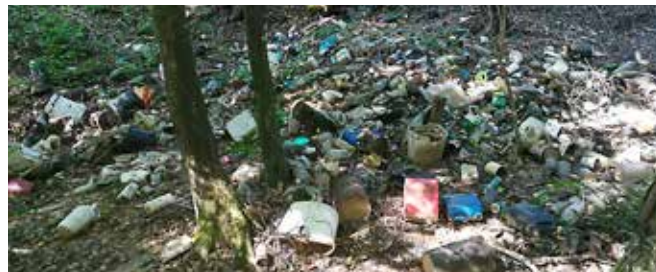
Mešani komunalni odpadki v gozdu Pečarovci

V Sloveniji je tako že tretjič bila organizirana nacionalna prostovoljska čistilna akcija pod sloganom ŠE ZADNJIČ in tudi tokrat združila prostovoljce v več kot 150 državah. Slogan Še zadnjič zato, ker je potrebno vse moči usmeriti v preprečevanje nastajanja odpadkov in posledično tudi smetenja. Čisto okolje za vedno bomo dosegli z zmanjševanjem, ločenim zbiranjem in ponovno uporabo odpadkov. Vsi skupaj poskrbimo, da Slovenija ostane čista za vedno.