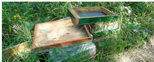
Čebelji panji odvrženi na jasi ob cesti v Mačkovcih

Razen izvedenih aktivnosti smo si ogledali in posodobili tudi register divjih odlagališč. Žal se na območju občine Puconci nahaja še veliko odlagališč, čeprav se jih je veliko že v preteklih čistilnih akcijah saniralo. Večina teh divjih odlagališč je sicer nastalo v preteklosti, ko je tako rekoč vsaka vas imela svoje divje odlagališče. Danes ta divja odlagališča zelo škodljivo vplivajo na okolje, saj onesnažujejo podtalnico, kvarijo videz pokrajine in kakovost življenja vseh živih bitij ter negativno vplivajo na zrak in prst. Na območju občine Puconci imamo evidentiranih 16 divjih odlagališč.