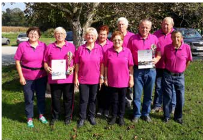
Balinarji v Bakovcih, foto: Vijola Bertalanič

Upokojenci, ki se ukvarjamo s športnimi dejavnostmi, smo veseli vsakega dobrega uspeha, pomembno pa je predvsem tudi to, da smo aktivni, da se družimo, da si ustvarjamo nove prijateljske vezi v občini, regiji in izven nje. Naši člani so tudi in še vedno pomagajo tistim, ki se na novo vključujejo v športne aktivnosti in še posebej veseli smo, ko so potem naši učenci boljši od nas. V aktivnosti, v katere se vključujemo, vlagamo veliko svojega prostega