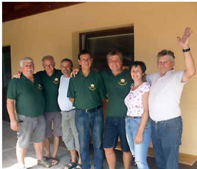
Udeleženci iz občine Puconci na 15. Veteranskih športnih igrah O ZVVS Murska Sobota

Janez Kološa, sekretar O ZVVS Murska Sobota