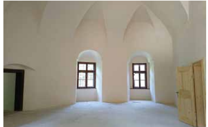
Obnovljena grajska kapela

V Javnem zavodu Krajinski park Goričko smo z uspešnim izvajanjem aktivnosti obeh projektov, ki sta sofinancirana s sredstvi iz Programa čezmejnega sodelovanja Interreg V-A Slovenija-Avstrija/Madžarska, že v drugi polovici, saj se oba končata sredi leta 2019, pričela pa sta se leta 2016.