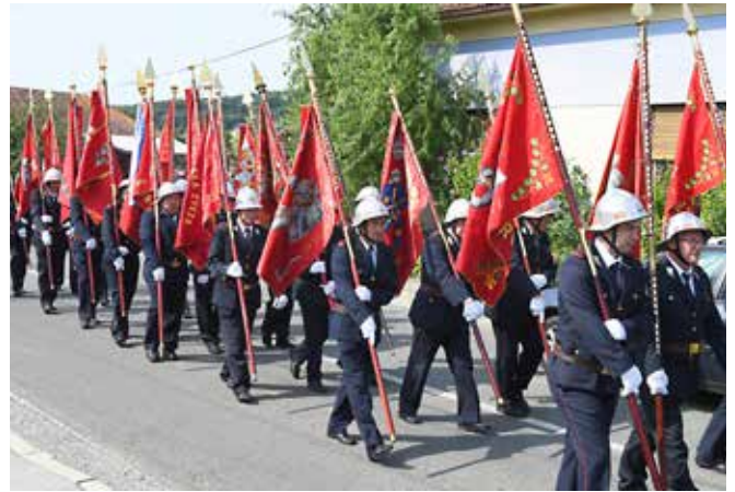
Parada ob 20. obletnici GZ Puconci

Letos smo izvedli volitve, zaključili cikel tekmovanj, organizirali smo 12. tabor gasilske mladine, letovali na Rogli, oktobra organiziramo še srečanje veteranov in vaje ob mesecu požarne varnosti ter tečaj za gasilca pripravnika. V 20 letih se je v GZ Puconci marsikaj dogajalo in lahko rečemo, da smo bili zelo aktivni in tudi uspešni. Po-