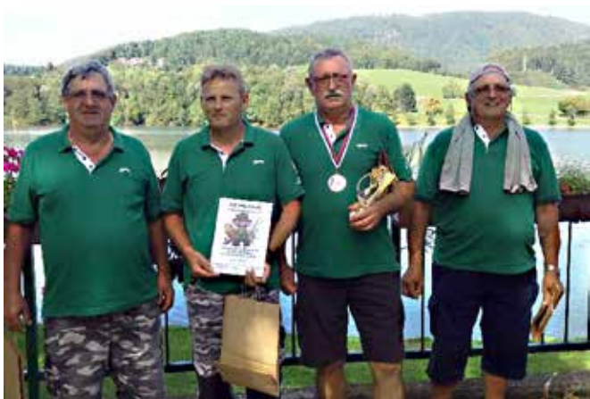
Ribiči iz DU Bodonci-Brezovci-Zenkovci na državnem tekmovanju, foto: Anica Krpič

upokojencev, ki sodelujejo, organizirajo in financirajo v celoti sami.