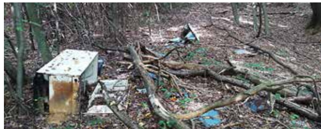
Kosovni odpadki v gozdu Otovci