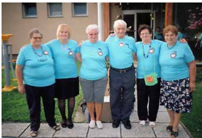
Udeleženci DU Puconci v Monoštru

in sicer različne teme, od zappestnic do risanja na steklo, kvačkanja, vezenja, darilne embalaže. Priponke so se naredile za vsakega udeleženca. Delavnice so trajale 3 ure, potem pa smo se zbrali v konferenčni dvorani, kjer so upokojenke iz Porabja pripravile kulturni program s plesom, petjem, skeči. Zaigrala je tudi harmonika. Na srečanju so bili tudi ugledni gostje, predsednik