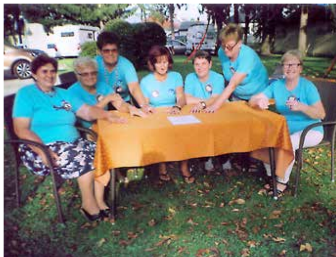
Delavnica - prstan iz perlic